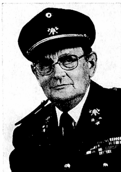
Commissaire de Police (1948-1978)

(Hornu, 2 mai 1918 – Soignies, 9 sept. 2002)